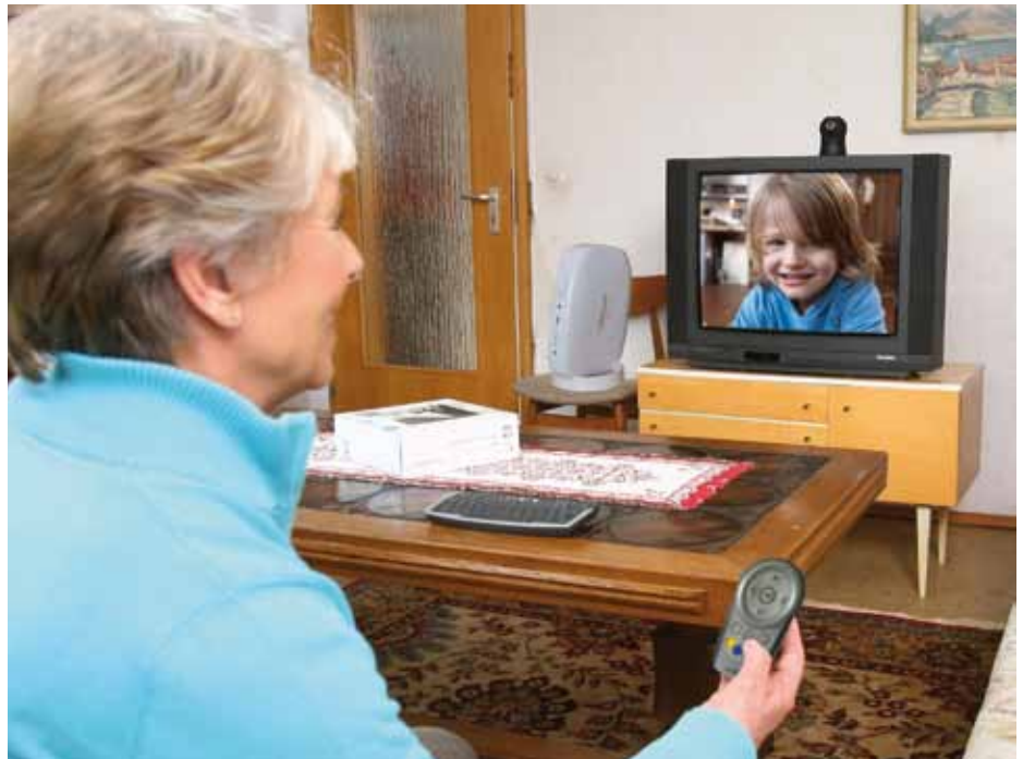
mia schafft soziale Nähe durch eine persönlichere Kommunikation mit Sicht- und Sprachkontakt

Durch den Anschluss einer eigens dafür entwickelten mia-Box kann der Mieter über den heimischen Fernseher mit Angehörigen und einem Dienstleistungszentrum kommunizieren, das rund um die Uhr an sieben Tagen in der Woche zur Verfügung steht. Der Mieter hat per Knopfdruck auf seiner Fernbedienung den direkten Zugang zu einer Vielzahl von Informationen, Angeboten und Serviceleistungen. Eine Kamera – z.B. eine bereits vorhandene Webcam – wird am Fernseher plat-