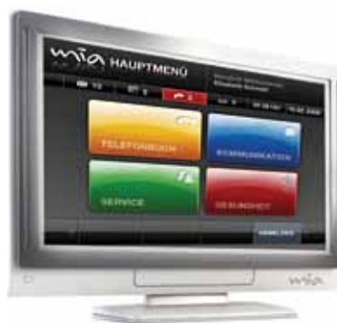
Über das TV-Menü werden alle mia-Funktionen gesteuert