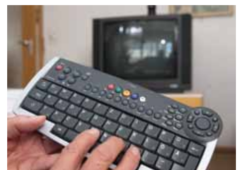
Eine drahtlose Tastatur sorgt für noch mehr Komfort bei der Kommunikation mit dem System mia

ziert und mit der mia-Box verbunden. Über den Breitbandkabelanschluss der Tele Columbus Gruppe werden die Daten, Video- und Audiosignale an das mia-Netzwerk übertragen.