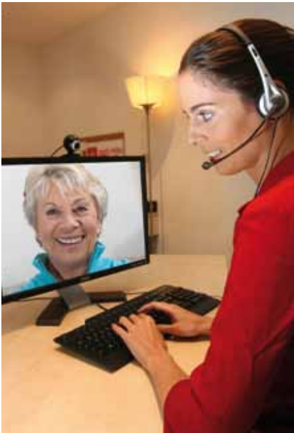
Service-Mitarbeiter stehen den mia-Teilnehmern 24 Stunden am Tag zur Verfügung

Kontakt: wohnungswirtschaft@telecolumbus.de